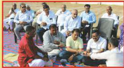
કચ્છની ઘોંગી ઘરામાંથી ઉત્કૃષ્ટ રમતવીરો પાકે એવા શુભ ભાવો સાથે 'હરિકો ભવન'ની ઈમારતનું ભૂમિપૂજન કરતાં કચ્છ યુવક સંઘ ના પદાધિકારીઓ

કિડ્સંગણનું આધુનિક અને જાજરમાન પ્રવેશદ્વાર